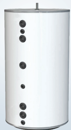
WT-V 750 FC DN80

I Thermias serie med volumtanker, har vi WT-V 100, WT-V 200, WT-V 300, WT-V 500, WT-V 750 og WT-V 1000, samt WT-V FC 500. Mer informasjon om hvert enkelt produkt, finner du på respektive produktblad.