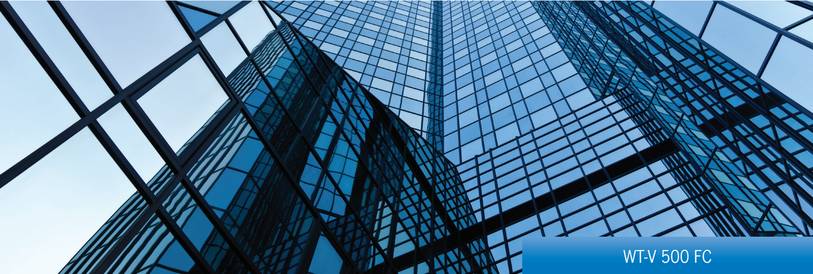
WT-V 500 FC