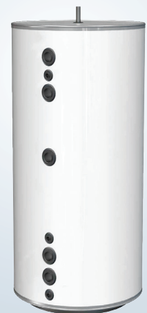
WT-V 500 FC DN80

I Thermias serie med volumtanker, har vi WT-V 100, WT-V 200, WT-V 300, WT-V 500, WT-V 750 og WT-V 1000, samt WT-V FC 500. Mer informasjon om hvert enkelt produkt, finner du på respektive produktblad.